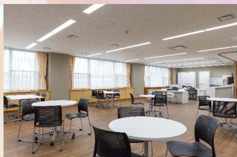
交流スペース・談話室・図書コーナー