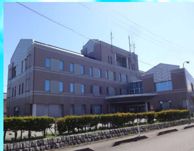
写真:長岡市役所和島支所

和島支所内には、1階に北部地域事務所、1・2階に和島支所、2・3階にわしまコミュニティセンターがあります。